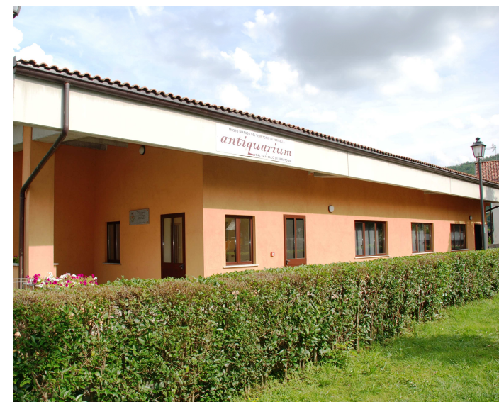
MUSEO DIFFUSO DEL TERRITORIO